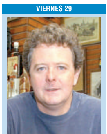
VIERNES 29 JUAN LUIS CANO ■ Miembro del dúo humorístico Gomaespuma. Periodista